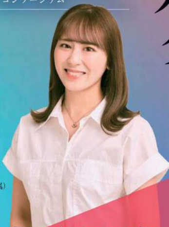
坂口 理子 元HKT48 (サンミュージック所属)