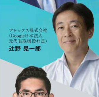
アレックス株式会社 (Google日本人 元代表取締役社長) 辻野 晃一郎