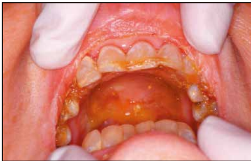
上あごに付着した痰