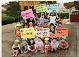
洗心保育園の子どもたちと職員(左から右へ、職員は前列から撮影)。