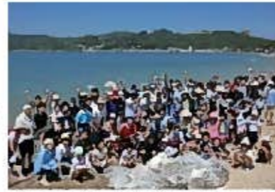
レクレーション活動の一つであるビーチバーベキュー大会では、社会貢献活動の一環として、家族とともに清掃活動も行う。