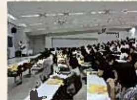
「ひまわり塾」の勉強会に参加している父親たち。