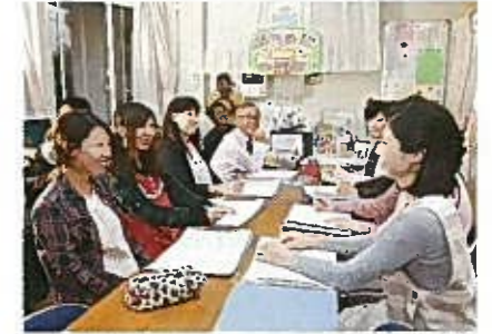
カムバック制度を利用し、長く働く職員が増えることで園内の運営も円滑にすすみ、園児の保護者の安心感につながっている。

出産・育児による退職者を再度雇用する「カムバック制度」という独自の再雇用制度を設けた。退職職員の会の開催や、園長と主任によるきめ細かなサポートなどの取組みにより、制度利用者は主任を含め、現職の先生の半数を占めるなど成果が表れている。また、時間外労働の減少に向けて職場を挙げての徹底した「ノー残業デー」の取組みと職員間のコミュニケーションを大事にすることで安心して働ける職場環境につながっている。