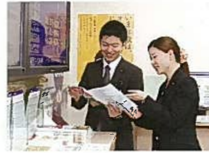
計画の前倒しやこまめな見直しも業務時間短縮につながっている。トップの思いや目標等は会議ではなく、短くても毎日の朝礼で伝えて意識の共有を図る。

業務時間短縮のため、支店独自の方策として、時短会議の実施、スケジュールなどの共有化、社用車の予約制などに取組み、労働時間の大幅な短縮を実現した。従業員の大半は業務効率化によって捻出された時間を通信教育や資格取得などの自己啓発にあてることで、結果として会社の業績向上も果たすという好循環を生み出している。