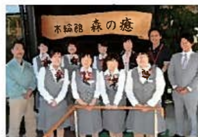
地域密着化の取り組みの一環として、近隣の福祉施設や高齢者施設へ、文芸への参加が恒例的になつたことで、関係も深まっています。