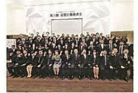
経営計画発表会やレクリエーション活動等を通じ、社内のコミュニケーション向上をはかる。以前に比べ女性社員の勤務年数も増加した。

女性の能力を発揮させるため、営業・事務・不動産管理などの各部門に男女を問わず配置し活躍の場を平等に与えている。また、プレゼンテーションにより評価を行う「昇進・昇格プレゼン制度」を新たに設け、自らの意思による昇進・昇格の機会を広げることで、新たな女性管理職の登用を促している。