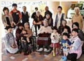
もやい聖友会の子供たちと職員(前列から撮影)。