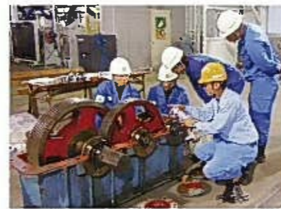
社員が専門以外の特長を持つ「多能工化」に取り組み、研修を定期的に行って技術の習得に努めている。

特定の作業に従事する社員の長時間労働解消のため、関連会社と連携し、専門以外の技術も習得させる「多能工化」に取り組み、技能の伝承も大事にしながら業務量の偏りを減らすことに成功した。また、男性社員が大多数を占める職場の中で設計部門や管理職に新たに女性を登用し、職域を拡大するなど女性の活躍を広げる取組みを進めている。