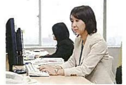
現在の会社でも「短時間正社員制度」を含む人事制度設計を担当し、柔軟な働き方ができる職場環境づくりに貢献している。

前職では経営コンサルタントとして業務に打ち込みながら、会社で女性社員として初めて出産を迎えることになった。出産後も仕事を続けるため、自ら会社に働きかけ、会社の理解と協力を得ながら、出産・育児に係る勤務制度を自ら作り、最初の制度利用者となる。また、これをきっかけに他の女性社員の出産・育児にもつながる結果となる。現在も4児の子育てと仕事を両立している。