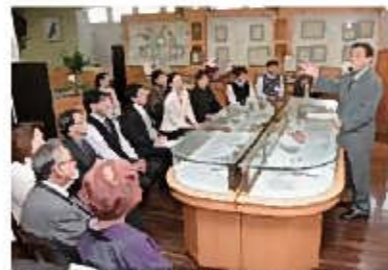
60年前から続いている朝礼新法。おもてなしの要素であり、従業員教育の場でもなる大事な時間。