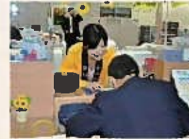
北九州銀行の男性行員が、小学校の授業参観に参加している様子。