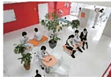
社内にあるリフレッシュゾーン。1日3回の休憩時には従業員が思い思いにくつこく。