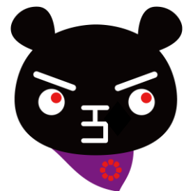
ブラックていたん

※受講者の要件： 種類は問わず生ごみコンポスト化容器を使用した経験があり、 受講後に生ごみコンポストアドバイザーとして活躍できる方