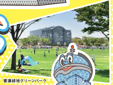
響灘緑地グリーンパーク