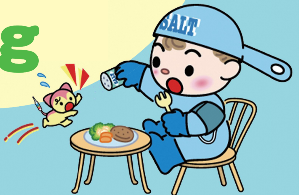
減塩啓発キャラクター 「良塩くん」