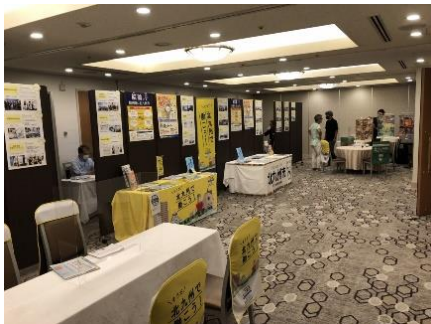
《相談会の様子(開始前)》