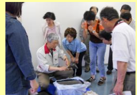
④今後の使用方法 の説明