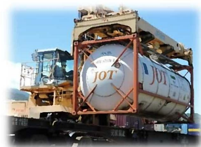
トップリフターによる荷役の様子