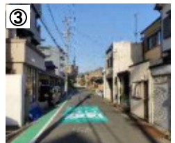
ゾーン30プラス路面表示