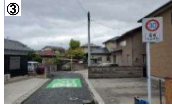
ゾーン30プラス路面表示

※ 今後、実施した対策の効果検証結果を行い、更なる対策の必要性等について検討していきます。(PDCAサイクルの継続的な取組)