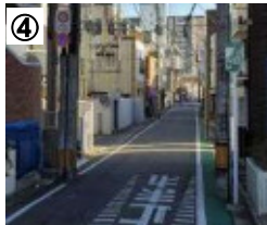
ゾーン30プラス看板

※ 今後、実施した対策の効果検証結果を行い、更なる対策の必要性等について検討していきます。(PDCAサイクルの継続的な取組)