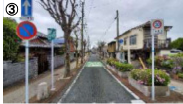
ゾーン30プラス看板・路面表示、一方通行

※ 今後、実施した対策の効果検証結果を行い、更なる対策の必要性等について検討していきます。(PDCAサイクルの継続的な取組)