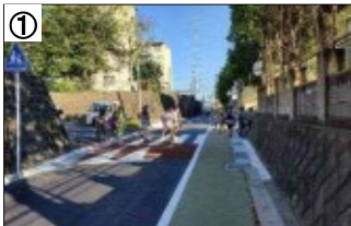
スムーズ横断歩道、登下校時の見守り活動