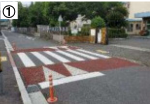
スムーズ横断歩道