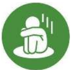
CASE 01 こども