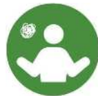
CASE 02 パパやママなど