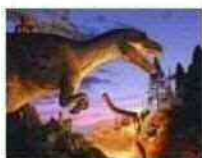
いのちのたび博物館