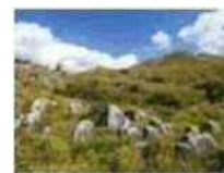
平尾台 カルスト台地