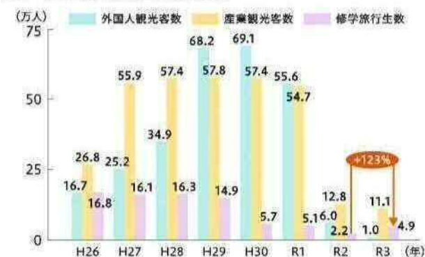
図 分野別観光客数の推移