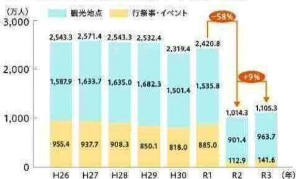
図 北九州市の観光客数(延べ人数)の推移