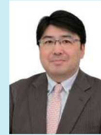
Kitakyushu International Film Festival Chairperson of the Executive Committee