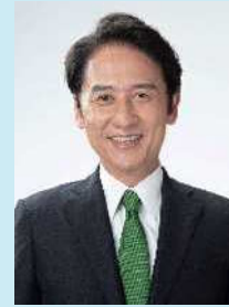
Mayor of Kitakyushu City