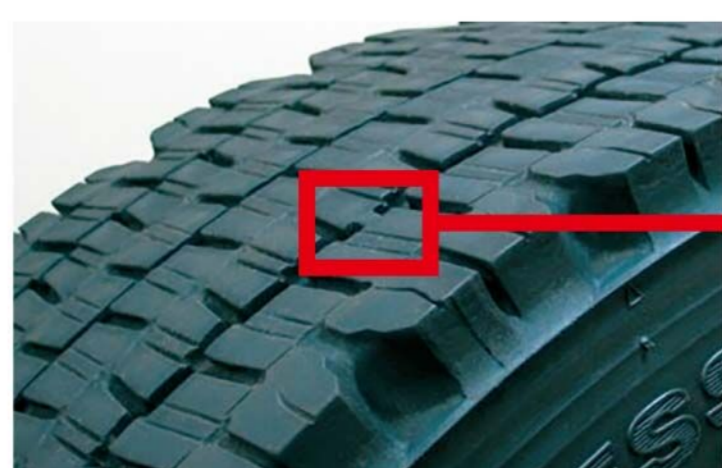
プラットホームとは新品時の溝深さから50%の位置にあるゴムの盛り上がりを設置した部分。