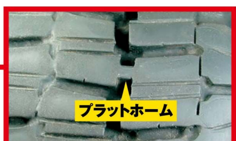
残り溝深さが「プラットホーム」に達していると冬用タイヤとして使用できません。