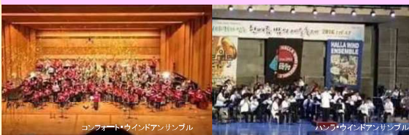
コンフォート・ウインドアンサンブル

《日韓文化交流》 ハンラウインドアンサンブル(韓国済州島を拠点に活躍)に出演いただきます。