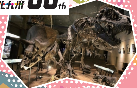
いのちのたび博物館