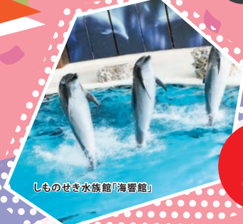
しものせき水族館「海響館」