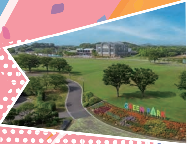
菅瀬緑地グリーンパーク