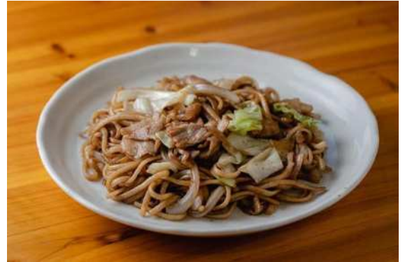
「だるま堂」の焼きうどん