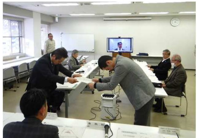
< 答申書の受け渡し >

神嶽川旦過地区整備室では、関係者の皆様へ事業についての情報提供を行っています。質問等がございましたら、お手数ですが下記までご連絡ください。