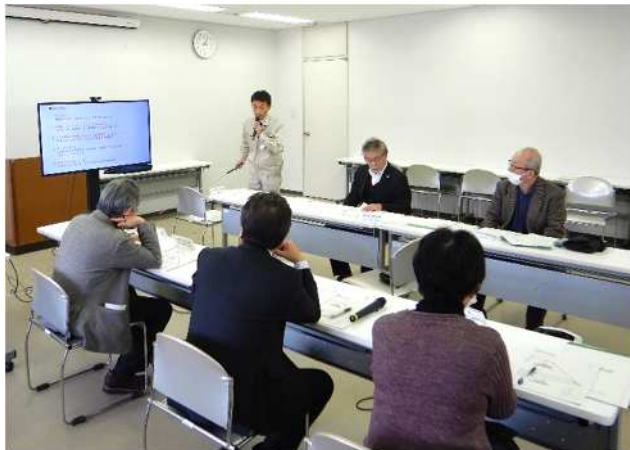
< 諮問内容の説明 >