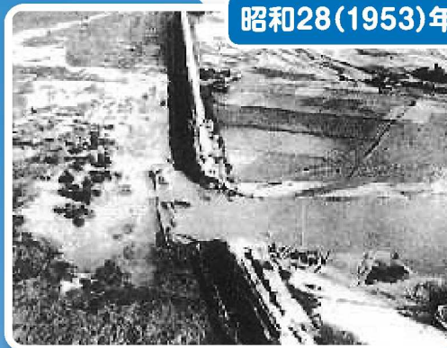
破堤氾濫による浸水状況(直方市)