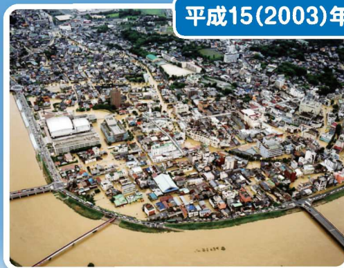
市街地の浸水状況(飯塚市)