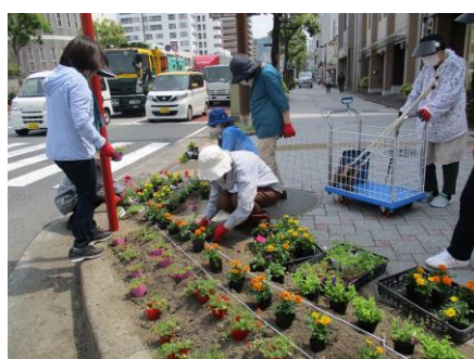
道路サポーターによる 清掃、花植え活動の様子