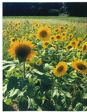
安屋地区

両地区では、農家を中心とした地域住民が、環境に配慮した農業と景観形成を目的に「ひまわり」の植栽を行っています。玄海国定公園の若松北海岸を走る国道495号沿いに点在、ただし満開後、種の結実前に刈り取られるため観花期間はそれぞれ限られます。※車の駐車は安全と地元への迷惑とならないよう十分配慮してください。