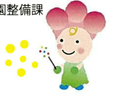
花新聞キャラクター ピッピちゃん

北九州市建設局 公園緑地部みどり・公園整備課 〒803-8501 小倉北区内1-1 TEL 093(582)2460