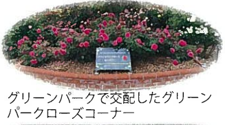
グリーンパークで交配したグリーンパークローズコーナー