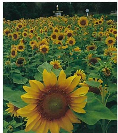
有毛地区