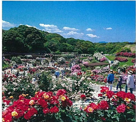
いろいろと香りに魅せられる春のバラフェア

5月上旬～ グリーンパークのバラ園は、福岡県最大級のバラ園として、春と秋のバラフェアには県内外から多くの来訪者が訪れます。春のバラフェアは、毎年5月初旬から6月初旬を予定しており、様々な催しものや販売などを行います。バラ園内の見どころは、世界的なバラの育種家としてミスターローズと賞賛された故鈴木省三コーナーや、グリーンパークで交配したグリーンパークローズコーナー等々、様々な趣向のコーナーを設けてバラ園を演出しています。