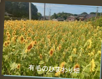
有毛のひまわり畑