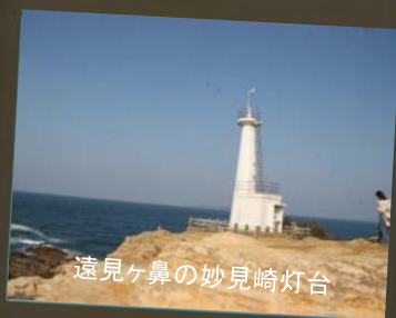
遠見ヶ鼻の妙見崎灯台