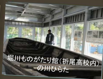
堀川ものがたり館(折尾高校内) の川ひらた