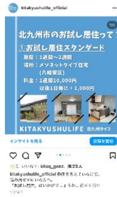
学生が制作したコンテンツ (Instagram)