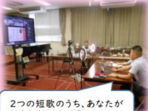
2つの短歌のうち、あなたが好きな方はどっち?

今年度最初の国語科の授業は、「短歌」の学習でした。「5・7・5・7・7」のリズムで表現された世界を一人一人の感じ方を大切にしながら鑑賞しました。慣れてくると、自分で作った短歌をチャットで見せてくれる児童生徒もいました。その表現力には、スタッフもびっくりしました。