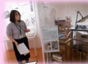
北九州市出身の漫画家が実際に使っていた仕事机や道具がありました。