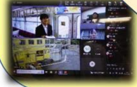
子どもたちには、このように見えています。チャット画面には、感想や質問がたくさん送られてきました。質問の中には、職員の方を悩ませるような専門的なものもありました。

【問い合わせ先】 北九州市教育委員会 不登校等支援センター TEL 641-1800