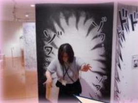
漫画の背景の前でポーズをとると、漫画の登場人物になった感じが味わえます。