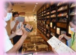
「漫画タイムトンネル」には、1945年から2012年までの漫画を展示しています。