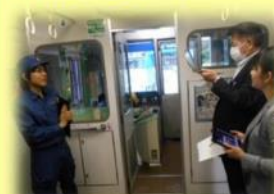
なかなか乗れない先頭車両からの景色や洗車の状況を見ることができました。

当日は、心配だった天気も何とか回復し、屋外からの配信も予定通りに行うことができました。普段は見たり体験したりすることのできないモノレールの「秘密」をたくさん教えていただきました。