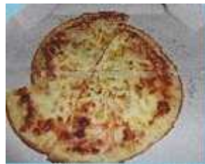
(ピザ、ケーキなどの食品を直接包装した容器)