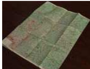
(地図、選挙ポスター)