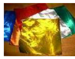
(金銀の折り紙など)