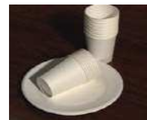
(紙コップ、紙皿、紙製のカップ麺容器など)