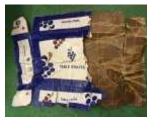
(輸入青果物・水産加工品を入れる段ボール箱)