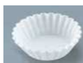
(クッキングシートなど)