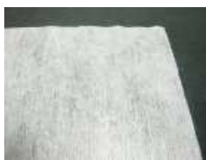
(マスク、簡易お手拭、 包装紙など)