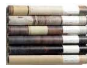
(壁紙、防水シートなど)