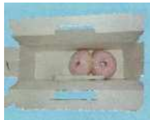
(ピザ、ケーキなどの食品を直接包装した容器)