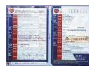
(公共料金の請求書)