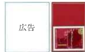
(サンプルが付いたままの 新聞折込チラシ、雑誌)