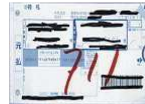
(宅配便の伝票など)