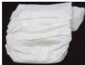
(紙おむつ、生理用品、 ペット用トイレシート)