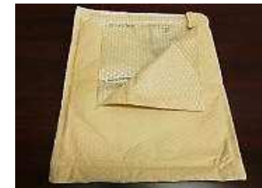
(通販用緩衝封筒など)