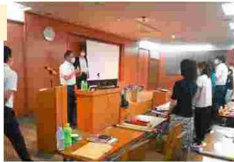
実践協力校における取組の具体