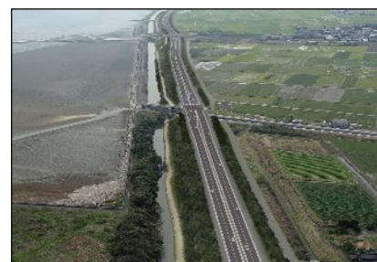
（完成イメージ）曽根東臨海スポーツ公園交差点付近