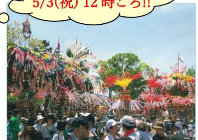
曽根の神幸行事の人形飾山

https://www.city.kitakyushu.lg.jp/kokuraminami/file_0100.html