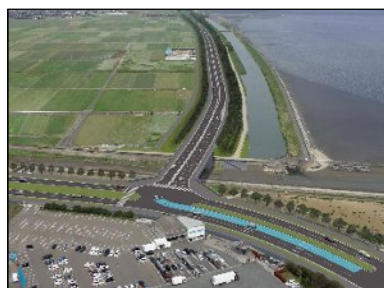
（完成イメージ）朽網北交差点付近