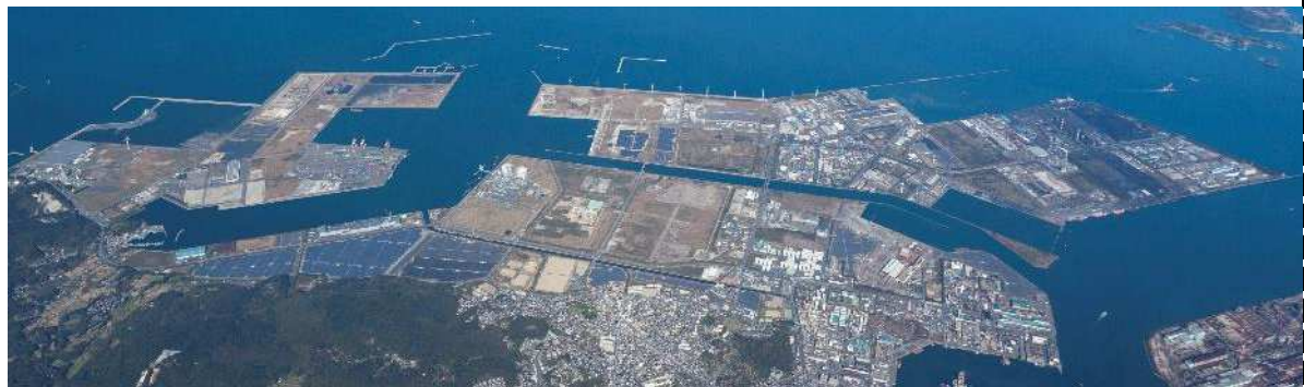
調査を行う北九州市響灘臨海エリア

このため、再生可能エネルギー由来等の国内製造と海外からの輸入のベストミックスによる水素等供給と、将来の拡張余地を十分に持った拠点整備が期待できます。