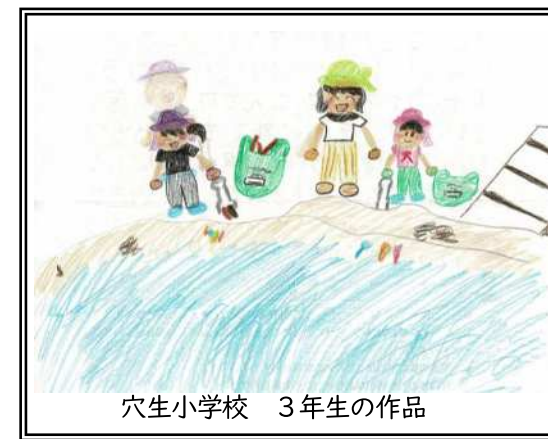
穴生小学校 3年生の作品

○ ゴミがいっぱいひろえてたのしかった。また、ゴミをいっぱいひろいたいです。 【医生丘小学校1年】