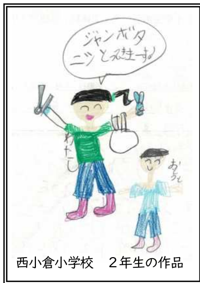
西小倉小学校 2年生の作品

○ ジャンボタニシは深い所にはなくて、浅い所にいることを初めて知りました。ジャンボタニシを見つける時間が30~40分ぐらいで、最後の合計で400gになったので重いと思いました。ジャンボタニシはアルゼンチンからどうやって来たか、体長は8cm以上など、初めて知れてうれしかったです。体験で、たくさんジャンボタニシのことを知り、とても良かったです。学校の宿題にもさんこうにしたいなと思いました。ありがとうございました。 【光貞小学校4年】