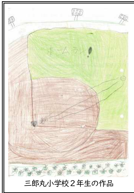
三郎丸小学校2年生の作品

○ おうえんすることが楽しかったです。とくに、ヒットをうったときにはもりあがりました。また、おうえんしたいです。ボランティアでは、ゴミがすくなかったけど、ゴミをひろったら近くにいた知らない人が「ありがとう。」と言ってくれて、とてもうれしかったです。【筒井小学校2年】