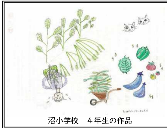
沼小学校 4年生の作品

○ ぼくは、くさむしりをしました。くさむしりは、たいへんでした。それと、やさいをとりました。ピーマンをたべました。おいしかったです。 【若園小学校1年】