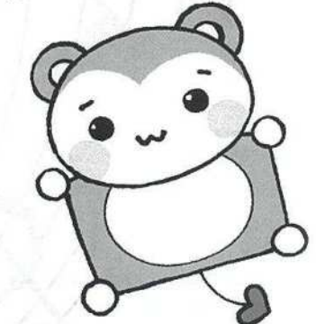
人権の約束事運動 マスコットキャラクター モモマルくん