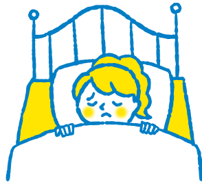
からだ体がだるい Tiredness