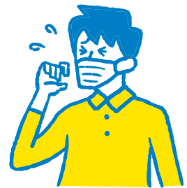
せき・たんがで出る Cough, Phlegm