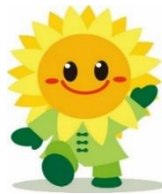
ひまわり太極拳公式キャラクター ひまわり太極拳スマッキー