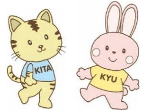
きたきゅう体操公式キャラクター 「キタちゃん」と「キュウちゃん」