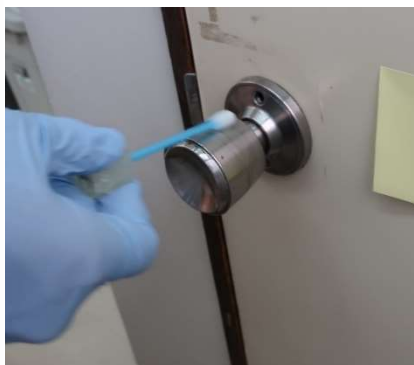
参考画像 拭き取り調査

暑い夏を乗り越えて10月に入りました。秋といえば食欲、スポーツ、芸術など結びつきのある言葉が浮かんできますね。今月の写真は「かき氷（しろくま）」です。