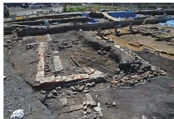
3号建物全景(北から)