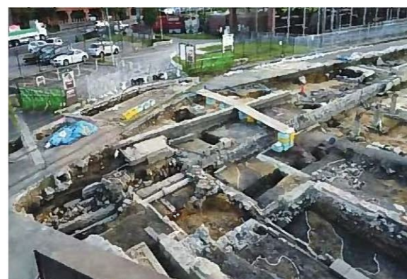
5号建物と周辺の遺構群(北東から)