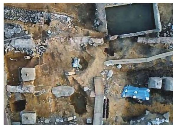
6号建物検出状況(上が南東)

おり、ここに間知石の跡形が残っている。このことから、4号と同様に上部に石垣が構築されていたことがわかる。