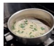
【な花ソース試作の様子】