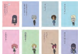
「妖狐×僕SS」ポチ袋8枚セット 約H97mm×W64mm、紙、1,100円(税込)