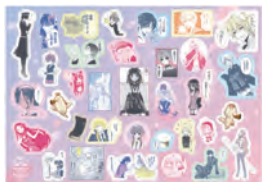
「藤原ここあコレクション」A4ステッカーシート A4、紙、1,200円(税込)