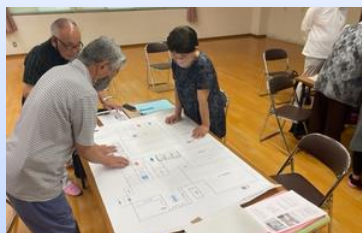
5年生 HUG “避難所運営ゲーム” (2階教室) 9:00～10:10