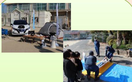
防災展示・応急担架 身近にあるものが 災害時の役に！