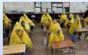
1・2年生 防災グッズ作成 (2階各教室) 9:00～10:00