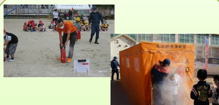
消火体験・煙体験 水消火器で消火体験と 煙の中で避難体験がで きます！