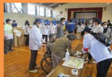
地域住民・6年生 避難所設営・運営 9:00～10:30