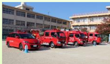
防災車両展示 消防・警察車両 自衛隊車両