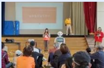
3・4年生 あそbousai (2階多目的室) 9:00～10:00