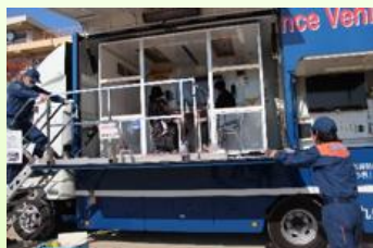
地震体験 震度6～7を 体感してみよう！ 10:30～12:00