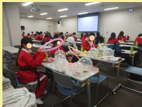
コムシティでの活動の様子