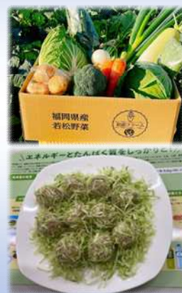
キャベツのしゅうまい