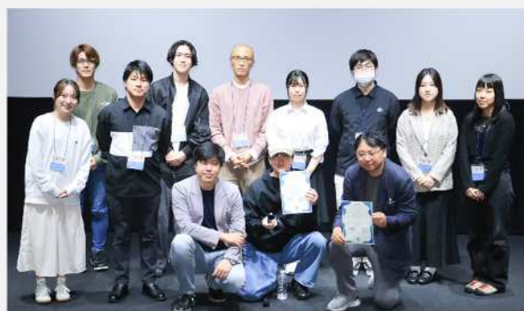
北九州国際映画祭2024「学生セレクション」発表時の集合写真（小倉昭和館）