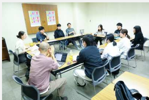
ミーティング・審査会の様子

昨年の1期生に、新たに10名の2期生が加わり、新生チームとして活動を開始します。学生が奮闘する姿を、ぜひ取材ください。