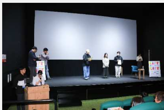
北九州国際映画祭2024「学生セレクション」学生登壇の様子（小倉昭和館）