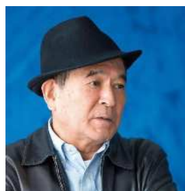
映画監督・北九州市文化大使 審査員 平山 秀幸 氏