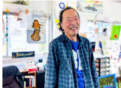
画家 黒田 征太郎 氏