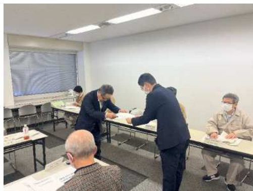
< 答申書の受け渡し >