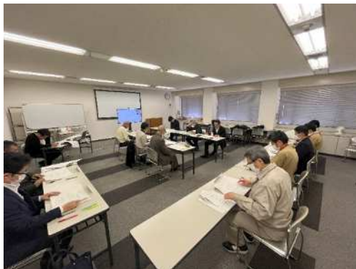
< 換地計画（第2回変更）の説明 >