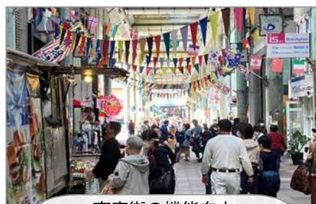
商店街の機能向上