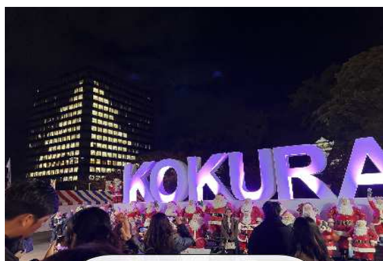
クリスマスマーケット