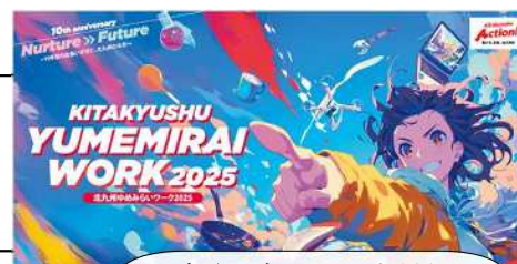
ゆめみらいワーク2025