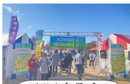
イベント「一期一食」