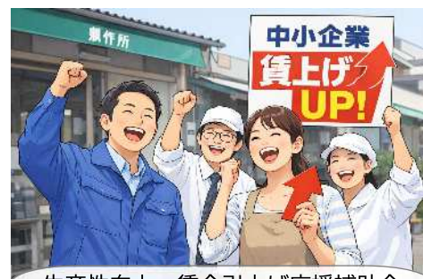
生産性向上・賃金引上げ応援補助金