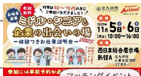
マッチングイベント