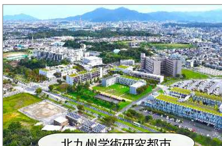
北九州学術研究都市