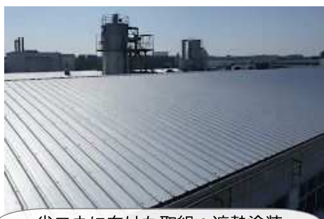
省エネに向けた取組：遮熱塗装