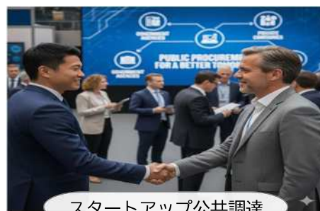
スタートアップ公共調達