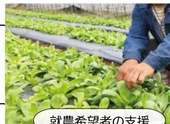
就農希望者の支援