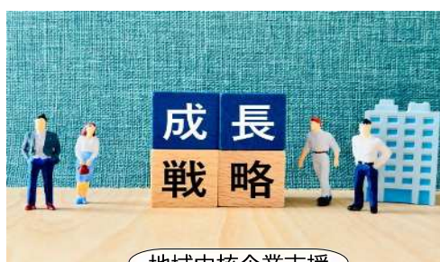
地域中核企業支援