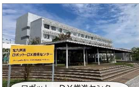
ロボット・DX推進センター