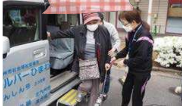
ひまわり送迎サービス