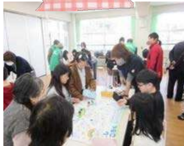
ふくしの出前授業