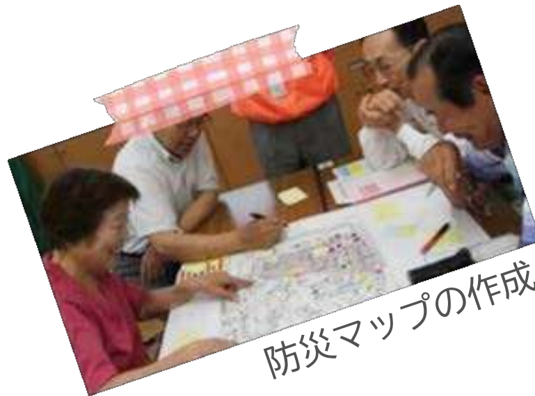
防災マップの作成