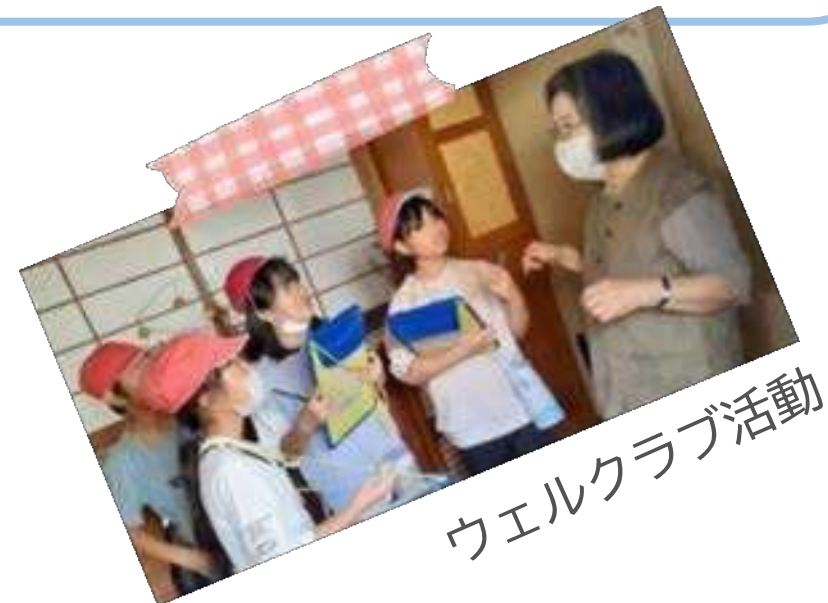
ウェルクラブ活動