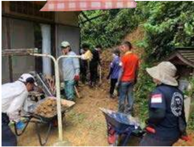
災害ボランティア活動