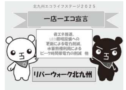
「一店一エコ宣言」宣言書