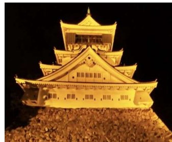
イエローライトアップ（イメージ）