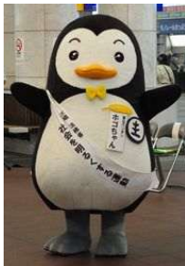
更生保護マスコットキャラクター 「ホゴちゃん」