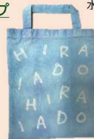
ろうけつ染めエコバッグ