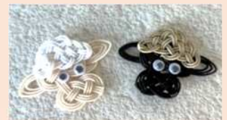
水引ひつじマグネットセット

平尾台の雄大な景色や自然をテーマに考案した、この場所でしか買えない雑貨や菓子が初登場。