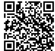
盛土規制法の運用について (県HP)