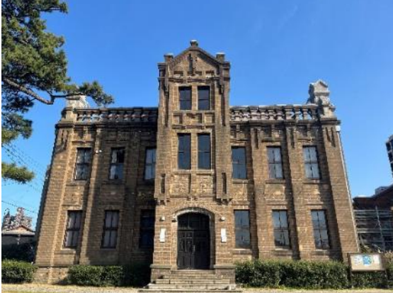
門司麦酒煉瓦館（外観）

門司麦酒煉瓦館は、歴史的建造物の重厚感を守るために専門家監修の下、改修を行いました。また、駐車場は、これまで実施されていた地域の催しでも使用できます。さらに今後はイベントの企画を行っていきます。