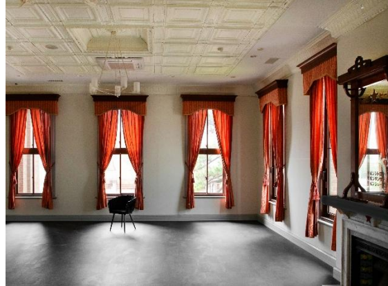
門司麦酒煉瓦館（内観）